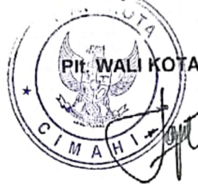
LETKOL (PURN) NGATIYANA